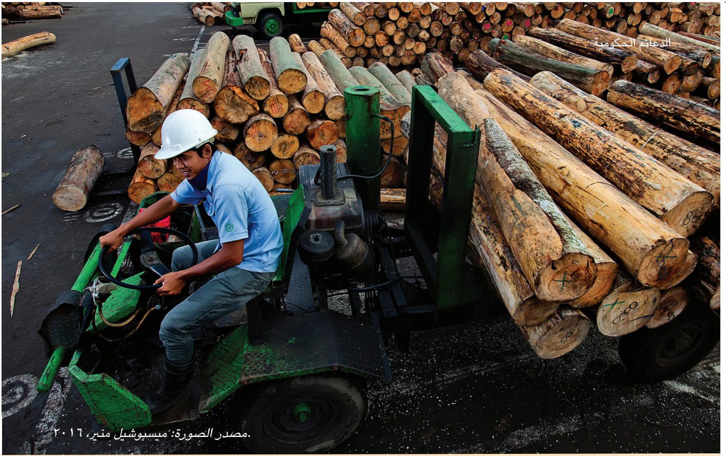
مصدر الصورة: ميسبوشيل منير، ٢٠١٦