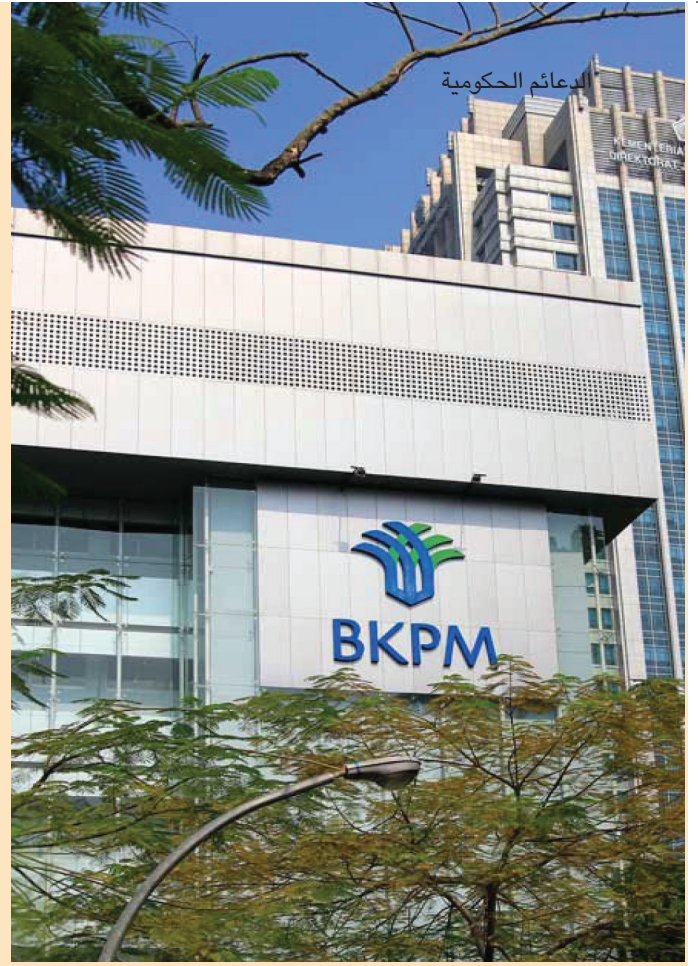
«صورة مبنى الهيئة الإندونيسية لتنسيق الاستثمار، ٢٠١٢»

ومن خلال عملها عن كثب مع اتحادات الأعمال والمستثمرين، تقوم الهيئة الإندونيسية لتنسيق الاستثمار دوماً بتشجيع الحكومة على إصدار سياسات داعمة للاستثمار.